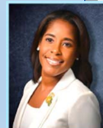
Victoria P. Siplin District 6 Commissioner Orange County